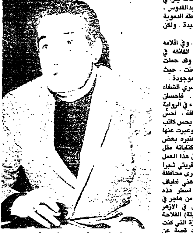
احسان عبدالقدوس عوالم الواقع